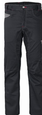
ZY – NERO/GRIGIO