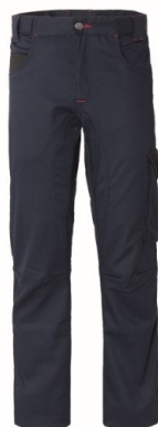
ZX – BLU/NERO