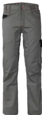
GY – GRIGIO/NERO