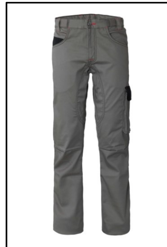
GY – GRIGIO/NERO