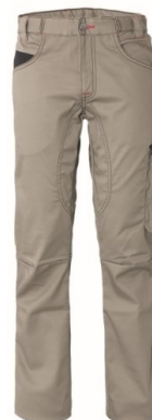
XA – BEIGE/BLACK